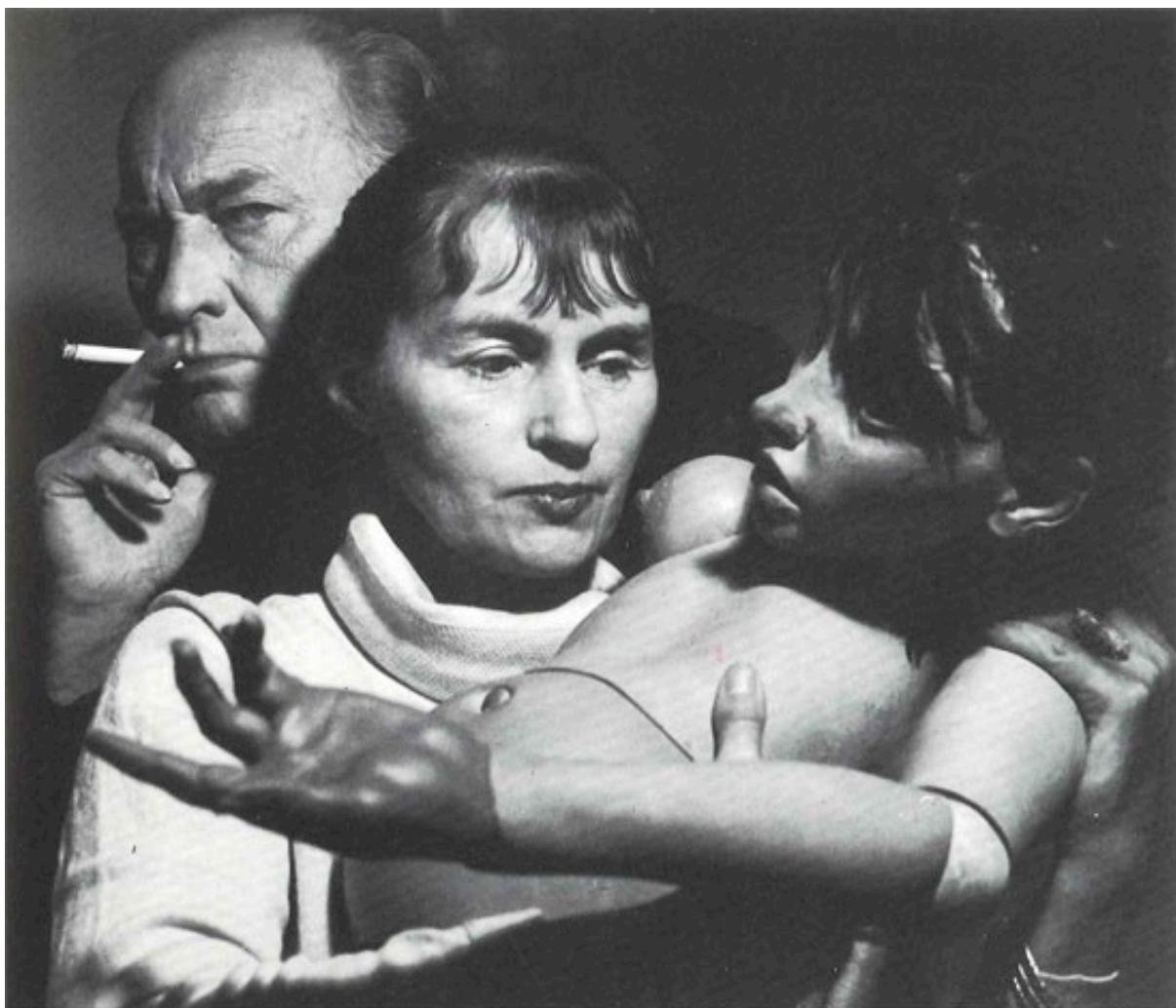
Unica Zürn avec son compagnon Hans Bellmer.